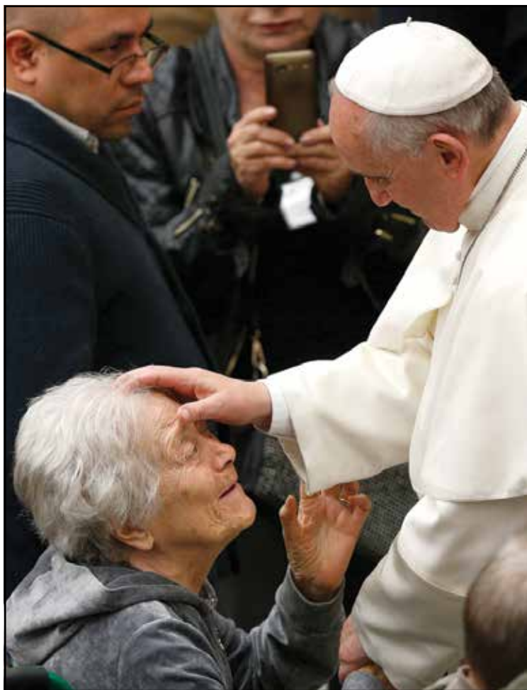
PAPA FRANCIS BENDICE MUJER —Francis Papa bendijo a una mujer durante una audiencia con personas que son sordas o ciegas en sala Paul VI en el Vaticano el 29 de marzo.

Francisco llama a todos y cada uno a un encuentro personal con Cristo. Éste produce una conversión que impulsa al encuentro con el otro