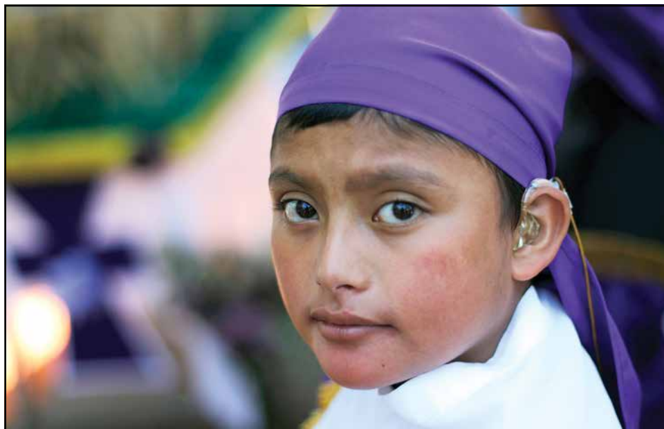
VIA CRUCIS —un niño vestido como un penitente participó en la procesión del Vía Crucis del año pasado en ciudad de Guatemala. Papa Francisco recientemente dijo que la fe es un tesoro que debe ser transmitido a los niños.

El Papa Francisco ha recibido esta mañana a los funcionarios y agentes de la Inspección de Seguridad Pública Vaticana, el organismo de la Policía de Estado italiana que se ocupa de la protección del Pontífice durante sus visitas en Italia y de la vigilancia de la Plaza de San Pedro, de acuerdo con las autoridades de la Santa Sede. Francisco les ha dado las gracias por su tarea, especialmente por la que desempeñan en la Plaza de San Pedro. “Todos somos conscientes de la necesidad de que se tutele la peculiaridad de este lugar singular, preservando su carácter de espacio sagrado y universal. Y para eso hace falta una vigilancia discreta pero atenta. Y efectivamente, en la Plaza de San Pedro, la gente se ve serena, se mueve con tranquilidad y hay un sentido de paz”. También se ha referido al trabajo de los agentes durante los acontecimientos en que participan más fieles, que vienen de todo el mundo para ver al Papa o para rezar ante la tumba de San Pedro y las de sus sucesores, “especialmente en las de