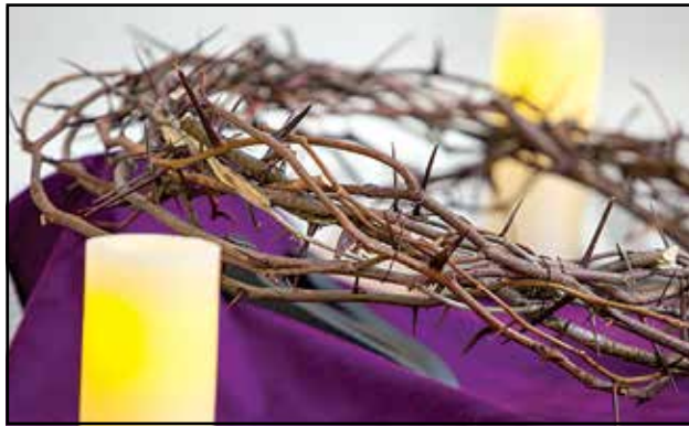
CORONA DE ESPINAS —Cristianos reflexionan sobre el sufrimiento de Jesús durante la Cuaresma, especialmente el viernes santo, observado el 18 de abril de este año.

que el Señor ha obrado por nuestra salvación dispone nuestra mente y nuestro corazón a una actitud de gratitud hacia Dios, por todo lo que Él nos ha donado, por todo aquello que cumple a favor de su Pueblo y de la humanidad entera.