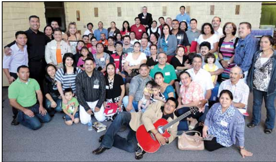
AMOR Y EL PLAN DIVINO —Retiro diocesano de parejas el 27 y 28 de mayo del 2011 en Springfield. Participantes de las parroquias en Kennett, Springfield, Neosho, Noel, Webb City, Mountain View, Monett, Carthage, y Branson.

Hicimos referencia al compromiso que hicimos en el altar ante Dios voluntariamente y nos recalcaron que cuando la sagrada escritura dice dejen a su padre y a su madre hace referencia al grado de madurez que deben de tener las personas al contraer matrimonio. Esposas sométanse a su marido no implica nunca que los hombres pueden pisar la dignidad del ser humano femenino o viceversa. Y ya no serán dos sino una sola carne.